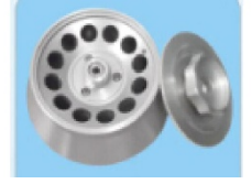
Kapasite: 12x5ml Maks. Hız: 13500rpm Maks. RCF: 12835xg