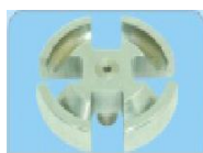
Kapasite: 4x10ml Maks. Hız: 6000rpm Maks. RCF: 3200xg