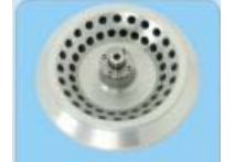
Kapasite: 48x0.5ml Maks. Hız: 13500rpm Maks. RCF: 13810xg