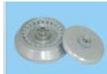
Kapasite: 24x1.5/2.2ml Maks. Hız: 13500rpm Maks. RCF: 16280xg