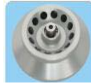
Kapasite: 12x1.5/2.2ml Maks. Hız: 16500rpm Maks. RCF: 18930xg