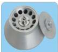
Kapasite: 12x10ml Maks. Hız: 12300rpm Maks. RCF: 15550xg